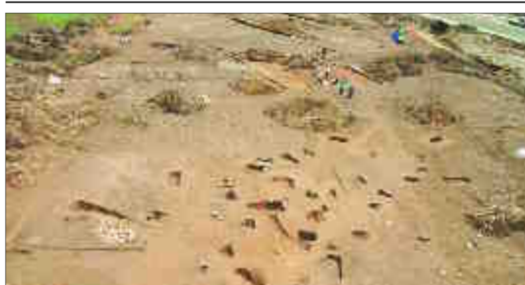
PREVAL – Bogato arheološko najdišče na trasi avtoceste mimo Radovljice.